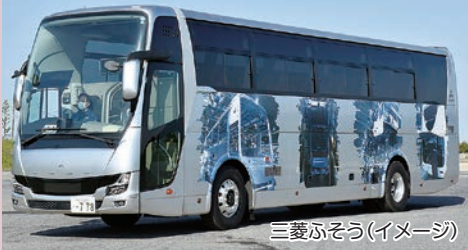
三菱ふそう(イメージ)