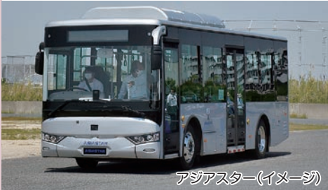
アジアスター(イメージ)