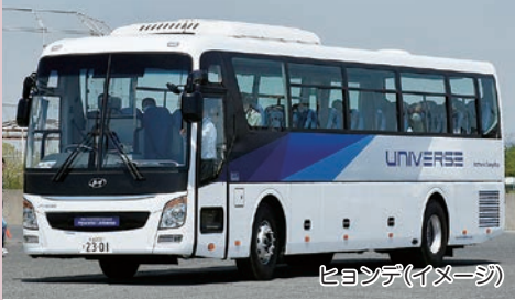
ヒョンデ(イメージ)