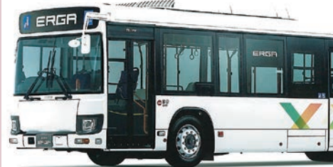
いすゞ自動車(イメージ)