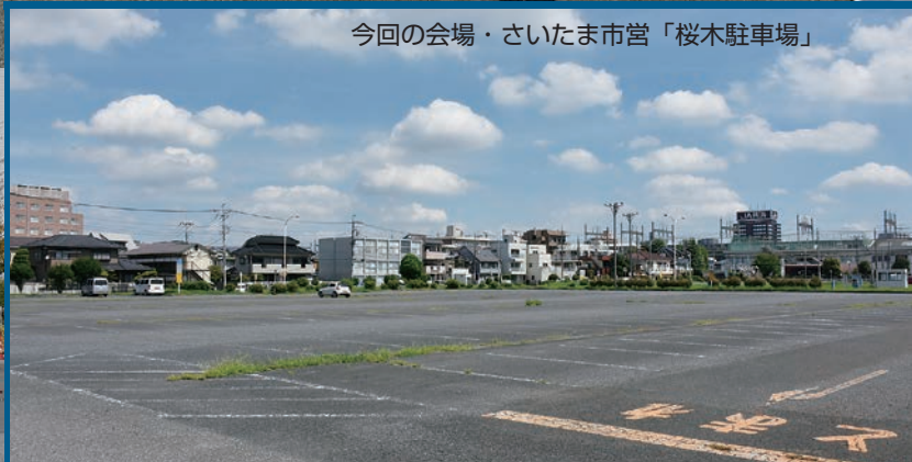
今回の会場・さいたま市営「桜木駐車場」

バスの最新技術が集結する体験型バスイベント「第9回バステクin首都圏」を、12月1日(金)、さいたま市の市営「桜木駐車場」(大宮駅から徒歩8分)で開催します。