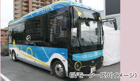
EVモーターズ(イメージ)