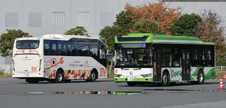
第8回バステクin首都圏の試乗会場