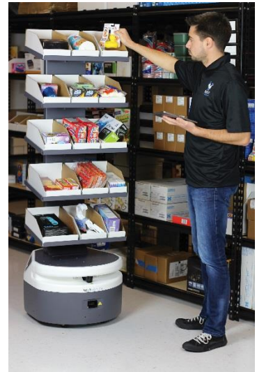
カスタマイズ一例

さらに、RFID などのセンサーとフレイトを組み合わせる「データサーベイ」を用いれば在庫の管理業務を円滑に行うことができます。通常業務に対する影響が小さい深夜に「データサーベイ」を利用することで業務効率を高める効果が期待できます。